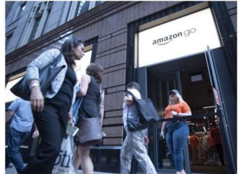
An Amazon Go store opened at 113 S. Franklin St. in September.