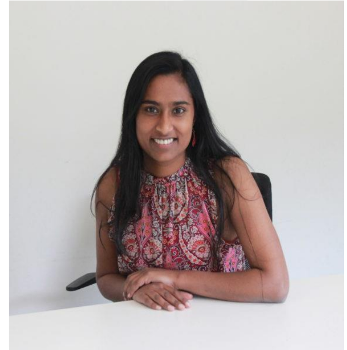
Maryanne Mariyaselvam Non-injectable Arterial Connector